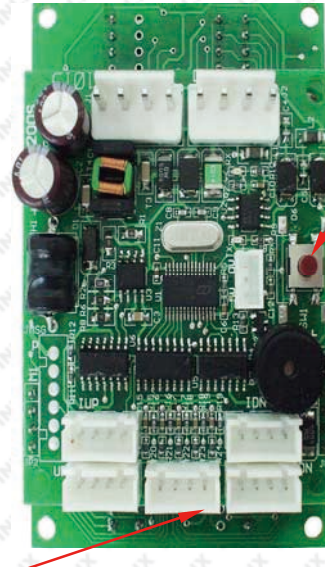
(2) SETUP 設定修改按鈕